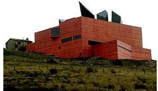
Jorge Oteizaren obra Alzuzako (Nafarroa) museo honetan dago.

Jorge Oteiza 2003ko apirilaren 9an hil zen.