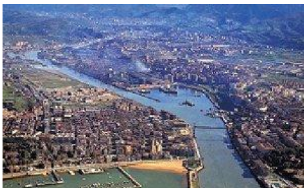
Bilbo, Nerbioi ibaiaren bokalean

Bizkaiko hiriburua da Bilbo eta probintziaren ipar-mendebaldean, Ibaizabal-Nerbioiren bokalean kokatzen da. 358.977 biztanlek osatzen dute Bilbo eta Euskal Herriko hiririk populatu eta industrializatuena da.