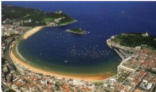
Donostia, Kontxako badia

Urgull eta Igeldo mendien artean, Kontxako badia dago; bertan, Santa Klara uhartea eta Kontxako eta Ondarretako hondartzak daude.